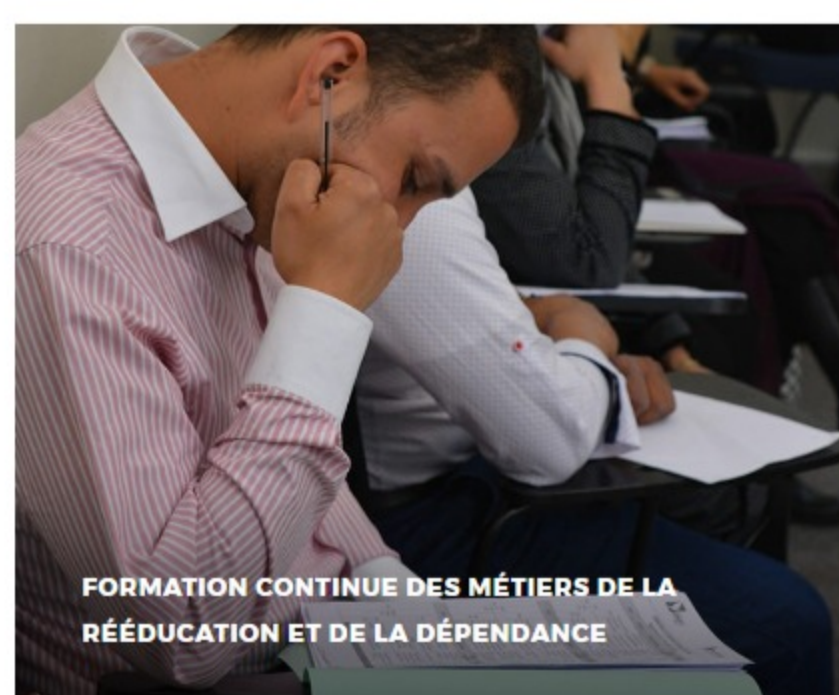
FORMATION CONTINUE DES MÉTIERS DE LA RÉÉDUCATION ET DE LA DÉPENDANCE