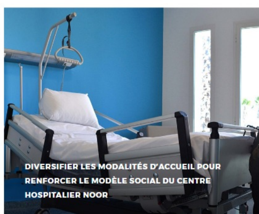
DIVERSIFIER LES MODALITÉS D'ACCUEIL POUR RENFORCER LE MODÈLE SOCIAL DU CENTRE HOSPITALIER NOOR