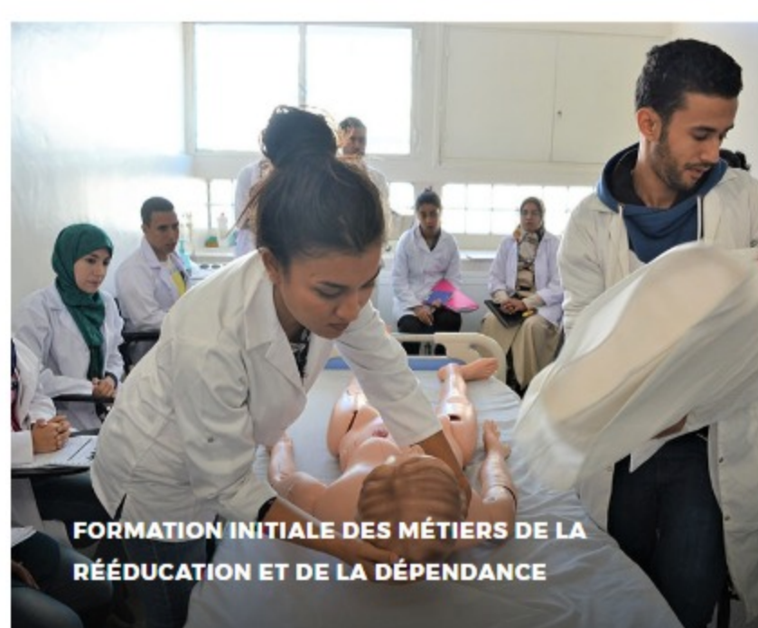
FORMATION INITIALE DES MÉTIERS DE LA RÉÉDUCATION ET DE LA DÉPENDANCE