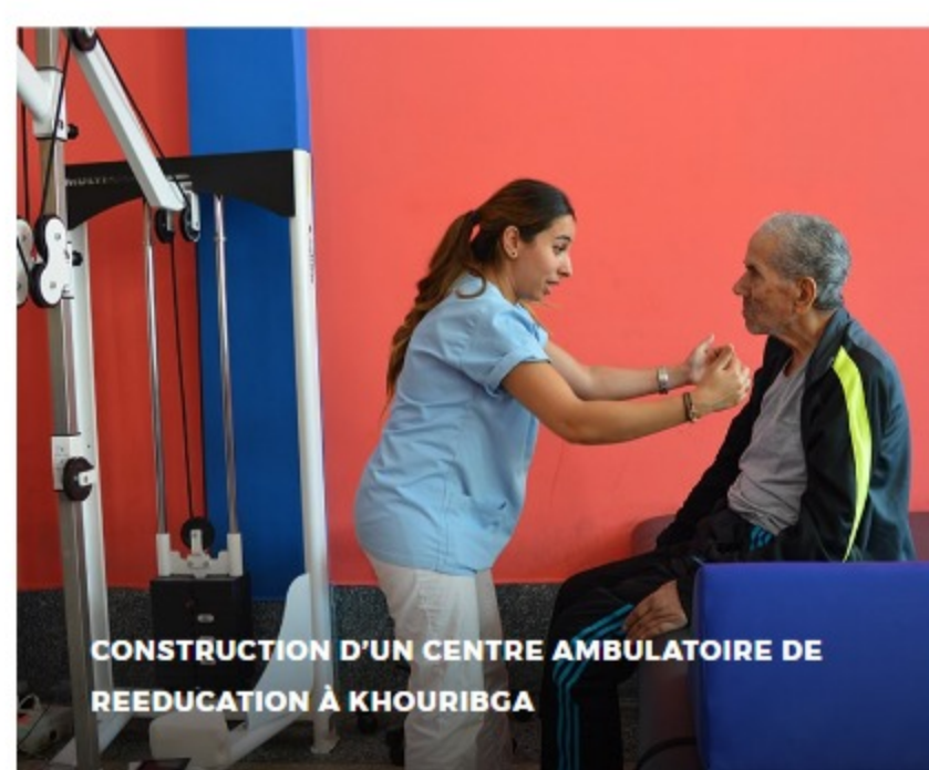
CONSTRUCTION D'UN CENTRE AMBULATOIRE DE RÉÉDUCATION À KHOURIBGA