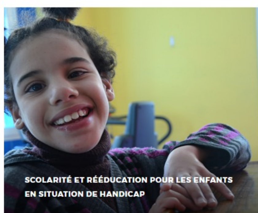
SCOLARITÉ ET RÉÉDUCATION POUR LES ENFANTS EN SITUATION DE HANDICAP