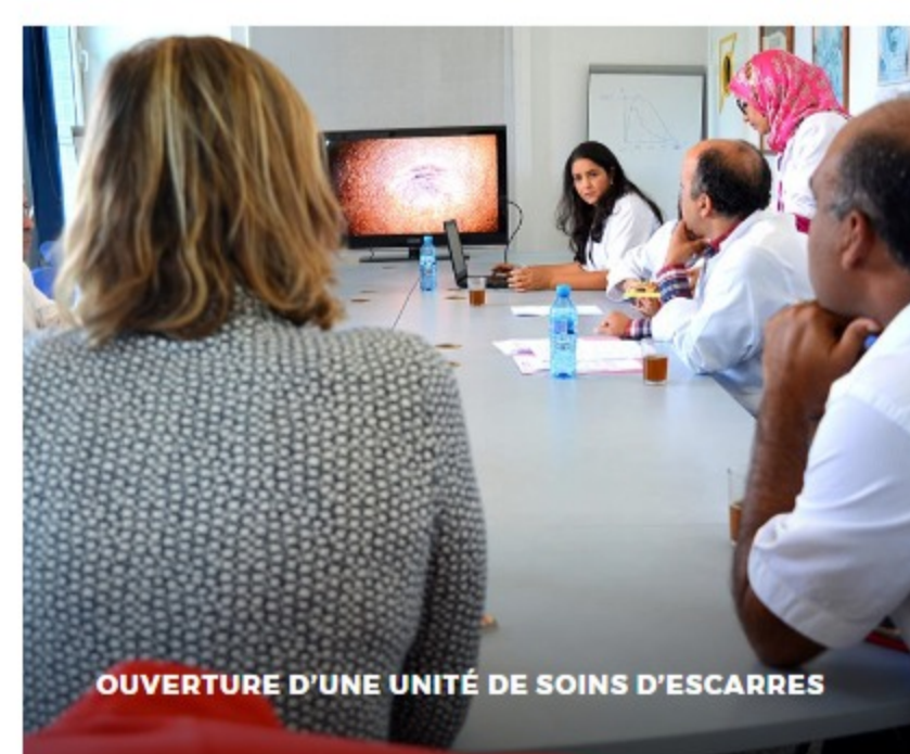
OUVERTURE D'UNE UNITÉ DE SOINS D'ESCARRES