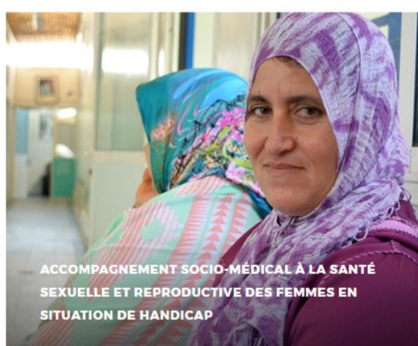
ACCOMPAGNEMENT SOCIO-MÉDICAL À LA SANTÉ SEXUELLE ET REPRODUCTIVE DES FEMMES EN SITUATION DE HANDICAP